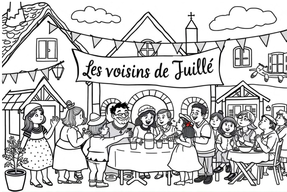
Coloriage pour petits et grands...

Avez-vous bien noté la date de la prochaine Fête des Voisins ?