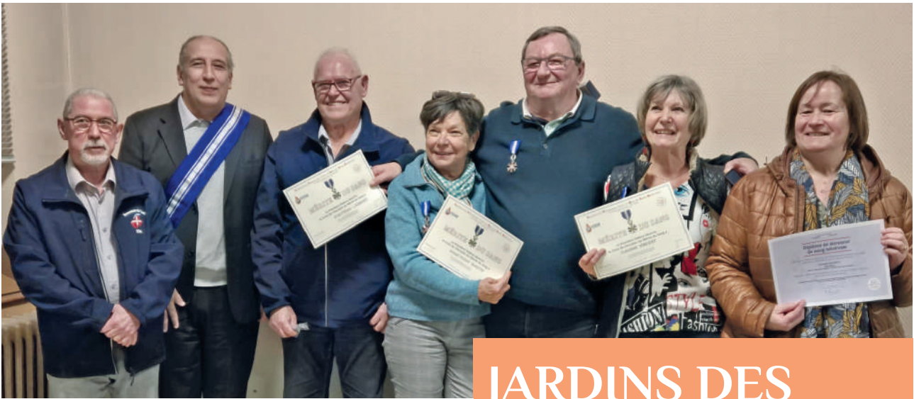
Lors de la dernière AG, des donateurs et des bénévoles ont reçu des distinctions pour souligner leur contribution à la cause de la transfusion sanguine.